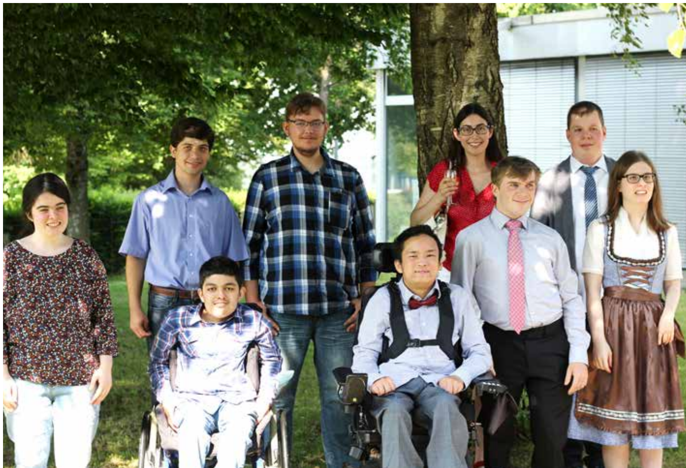
Die AbsolventInnen 2021 der Ausbildung der Sauterleuteschule.