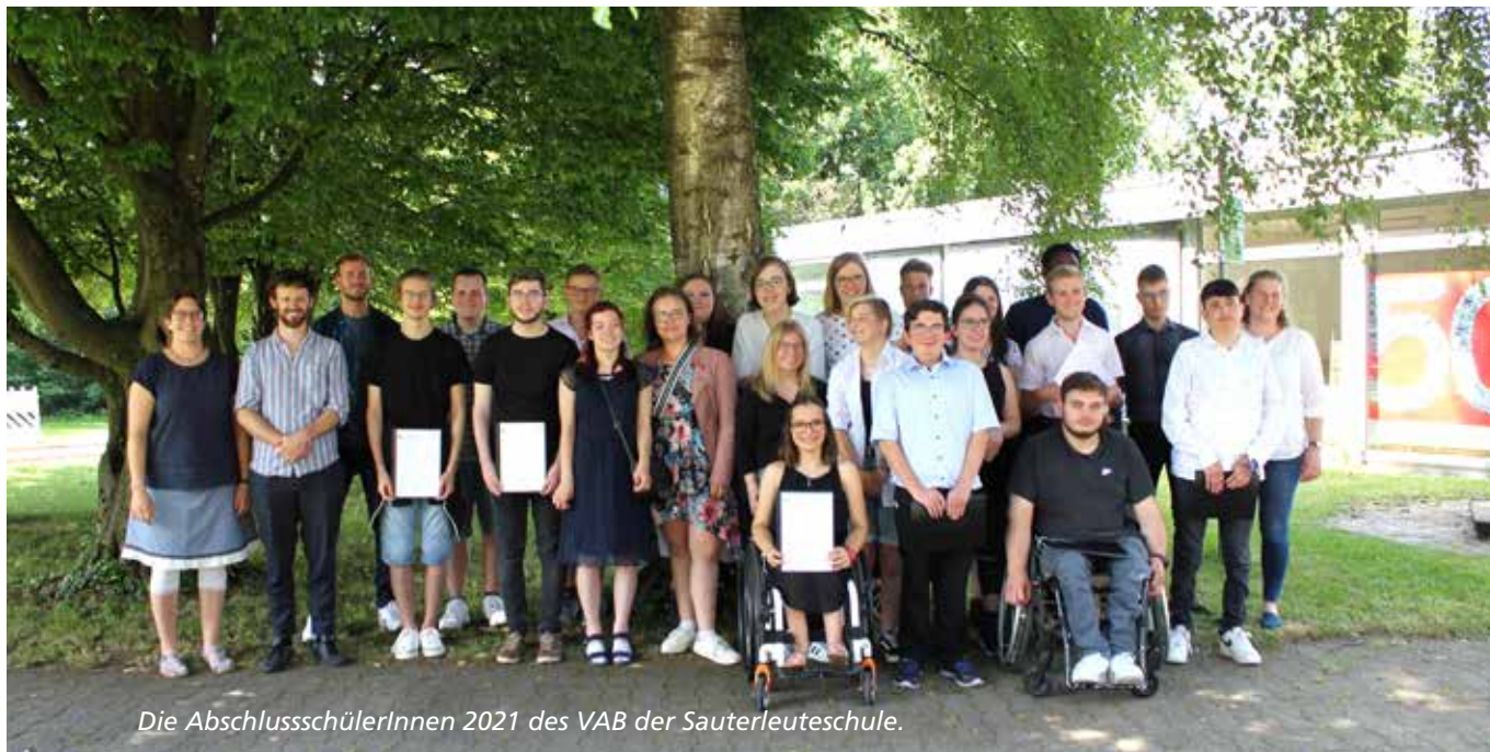
Die AbschlusschülerInnen 2021 des VAB der Sauterleuteschule.

„Manchmal muss man eigene Grenzen überwinden und einen Schritt oder auch Sprung ins Ungewisse wagen“ *